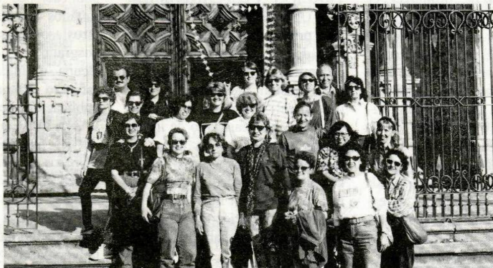
Académicos de la Universidad de Florianópolis, Brasil, que asistieron al curso "Evolución de la Cultura Mexicana" en la Cd. de México, organizado por UDUAL.