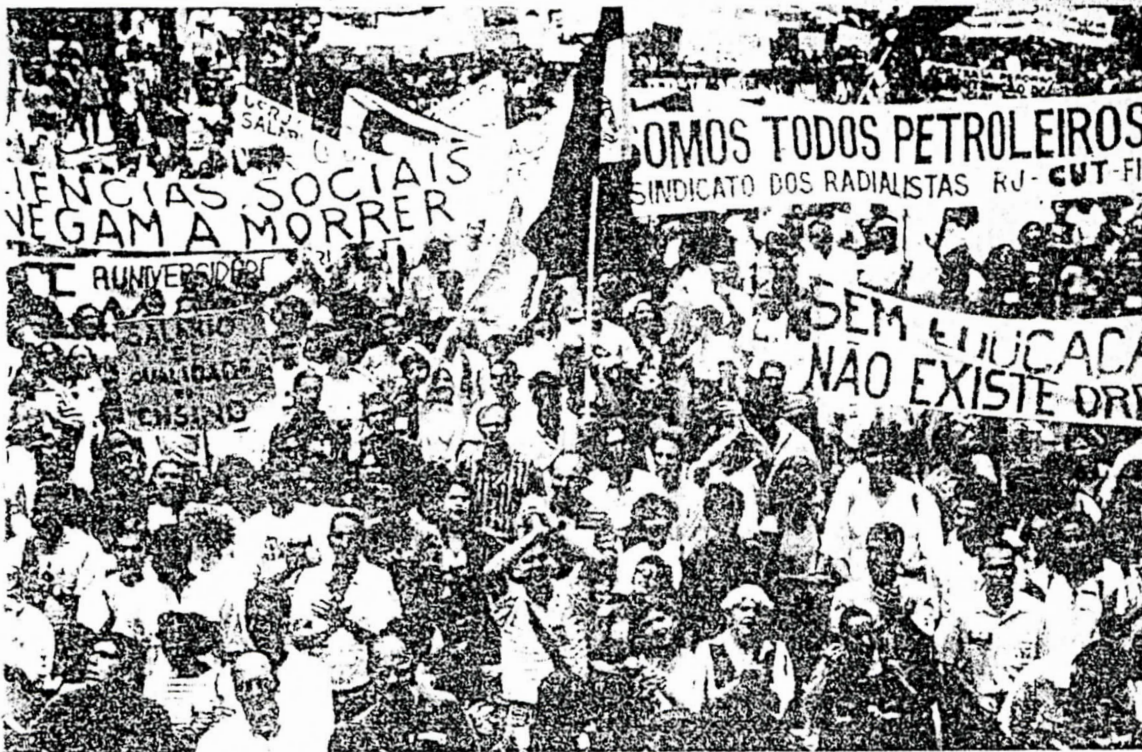
Miles de trabajadores petroleros brasileños marcharon por las calles de Rio de Janeiro en el contexto de su movimiento huelguístico en demanda del cumplimiento de un acuerdo salarial pactado con el anterior presidente, Itamar Franco. Otros miles de estudiantes y maestros universitarios se unieron a esta protesta obrera.

Detrás del enfrentamiento, posible guerra de intereses cruzados, según la prensa