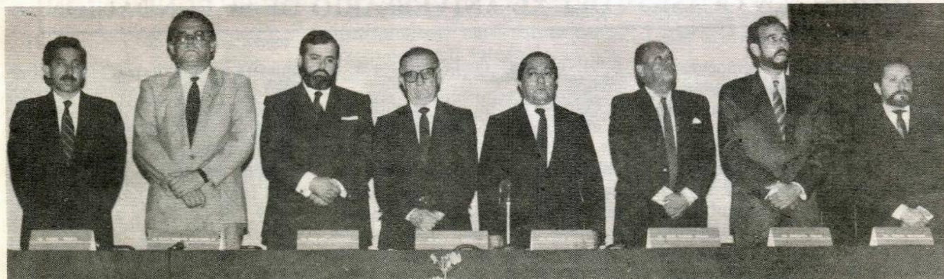
Miembros del Consejo Ejecutivo durante la ceremonia del XL Aniversario de la fundación de la Unión de Universidades de América Latina.

Interpretando el sentimiento de las delegaciones asistentes al Congreso y en general al deseo de todas las universidades latinoamericanas de crear un organismo que promueva su mejoramiento y establezca entre ellas