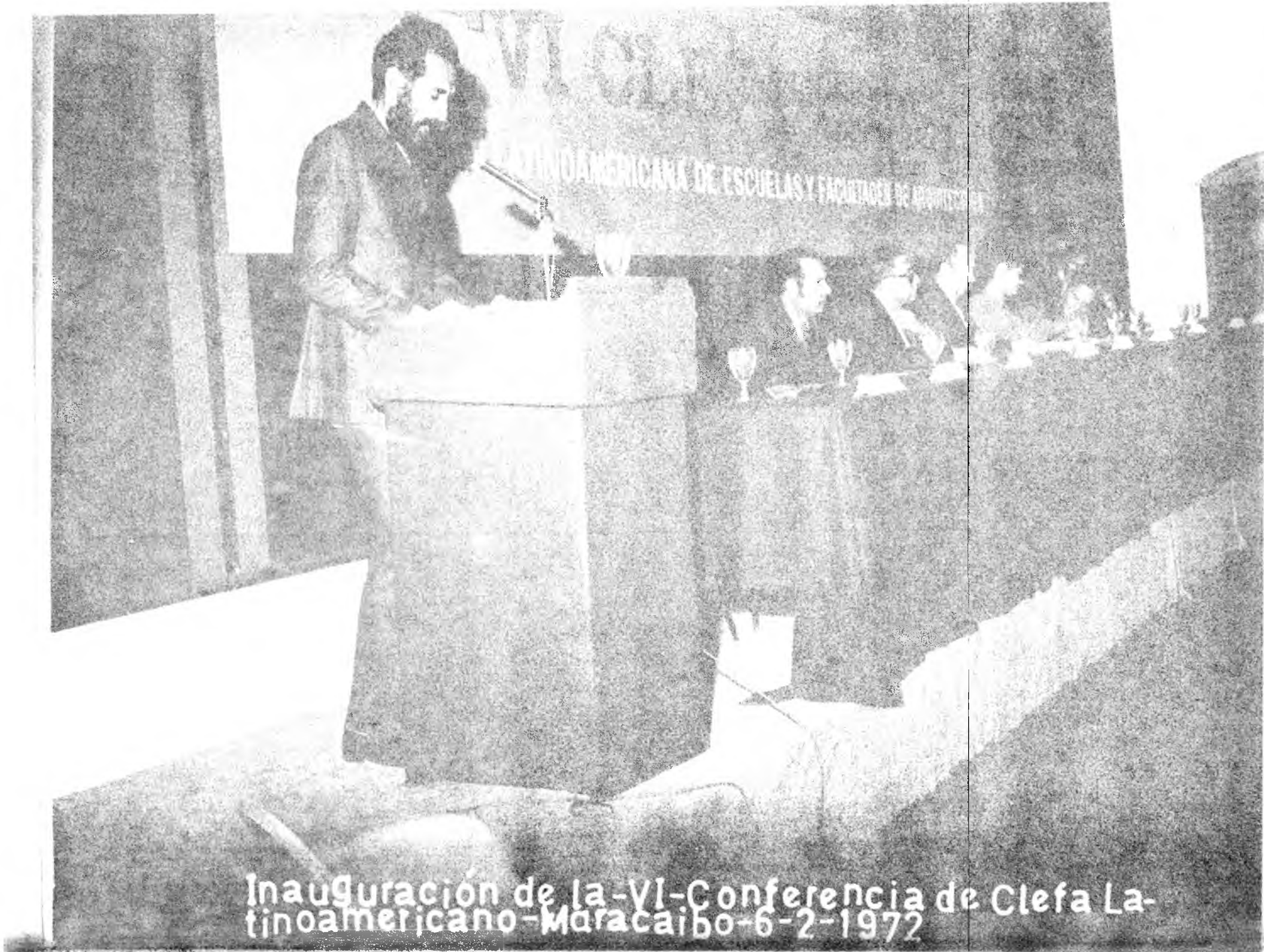
Inauguración de la -VI- Conferencia de Clefa Latinoamericana - Maracaibo - 6-2-1972