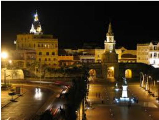
Cartagena de Indias 2008